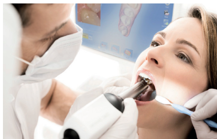
Aufnahmen mit der Mundkamera; Einfach, schnell, präzise

konstruiert und anschließend aus Keramik gefertigt und unmittelbar im Mund eingesetzt.